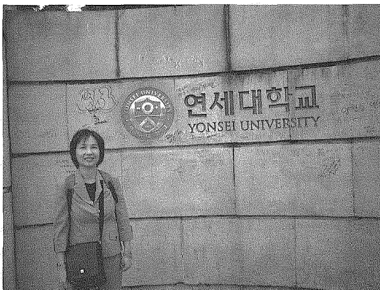
圖2 筆者在延世大學留影